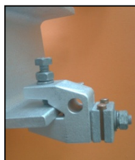
KAGO-Sollbruchschraube M12x50. Ideal für KAGO- Schraubklemmen 34.B.

KAGO screw with predetermined breaking point M12x50. Ideal for KAGO mast clamps 34.B.