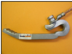
KAGO-Sollbruchschraube M12x20. Ideal für KAGO-Klemmen GI und EI.

KAGO screw with predetermined breaking point M12x20. Ideal for KAGO rail contact clamps GI and EI.