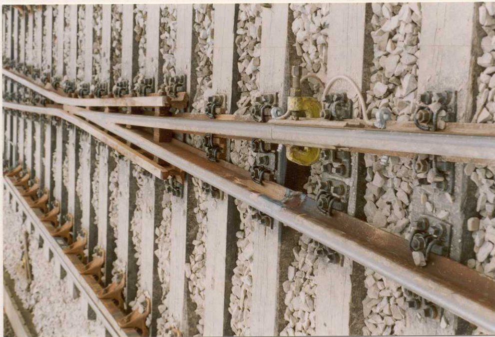
Herzstück- stoß schon teilweise verschweißt.