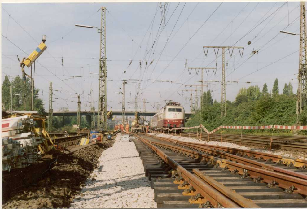
Weichen- umbau Essen Hbf am 28/29.8.