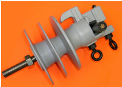
Kabelführung oben Cable on top