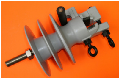
Kabelführung seitlich Cable at the side