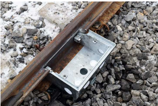
Kasten montiert an abgetrennter Rille, noch ohne Achszähler.