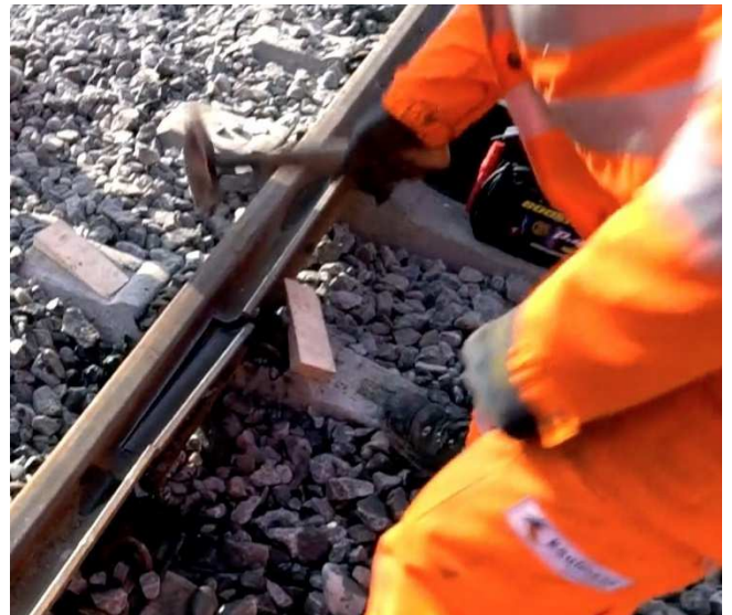
Abgetrennte Rille wird mit Hammer herausgeschlagen.