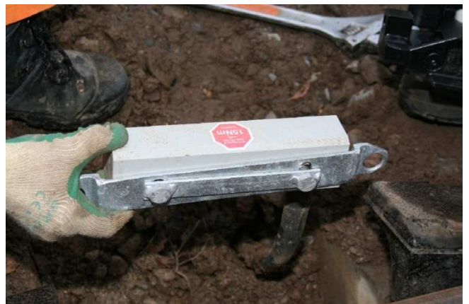
Achszähler/Radsensor an Halterung.