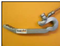
KAGO-Sollbruchschraube M12x20. Ideal für KAGO-Klemmen GI und EI.

KAGO screw with predetermined breaking point M12x20. Ideal for KAGO rail contact clamps GI and EI.