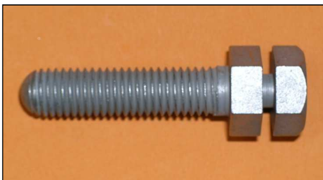
KAGO-Sollbruchschraube M12x50. Ideal für KAGO- Schraubklemmen 34.B.

KAGO screw with predetermined breaking point M12x20. Ideal for KAGO rail contact clamps GI and EI.