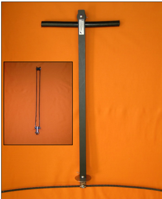
Mit Rolle und Funkenschutz für Temporär- und Dauereinsätze. Art.Nr. 618250.450V

Im Bereich von Brücken, Tunnels, Depots usw. muss in häufigen Fällen das Tragseil isoliert montiert resp. ein isoliertes Tragseil eingezogen werden, damit die elektrischen Sicherheitsabstände eingehalten werden können. In solchen Fahrleitungsabschnitten garantiert der neue, nicht-leitende KAGO-Fahrdrahthänger ein sicheres Aufhängen des Fahrdrahtes. Auch bei hoher Luftfeuchtigkeit sind damit elektrische Überschläge ausgeschlossen.